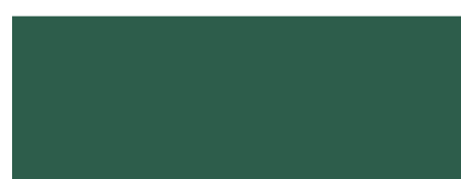
VERDE VITTORIA COD. 509