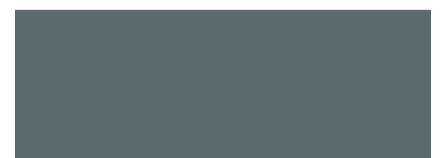
GRIGIO COMETA COD. 836